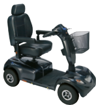
Invacare Comet Alpine