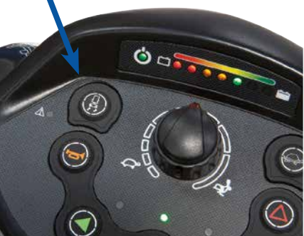
Selettore di riduzione della velocità

Comet Alpine ha un allestimento di tutto rispetto: sedile girevole, traslante ed estraibile tipo "Autostyle", regolabile in altezza con schienale inclinabile, braccioli allargabili e regolabili in altezza. Manubrio ergonomico con piantone inclinabile, freno a mano, cruscotto chiaro e completo con selettore di "riduzione automatica della velocità". Carenatura con parafanghi avvolgenti per proteggere le parti elettriche dall'acqua e dallo sporco.