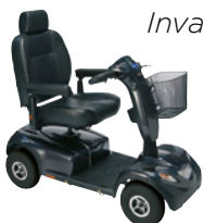
Invacare Comet HD